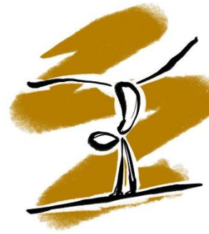
Turnen TSV Stadtlauringen