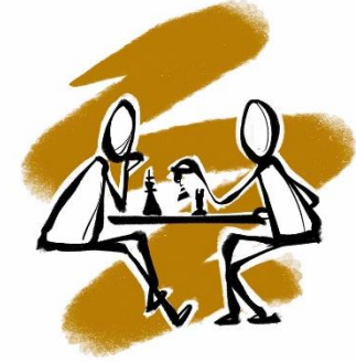
Schach Schachclub Bad Königshofen