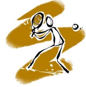
Tennis Rot-Weiß Bad Königshofen