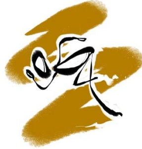
Leichtathletik TSV Münnigerstadt