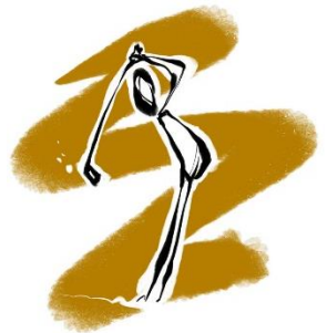
Golf Golfclub Maria Bildhausen